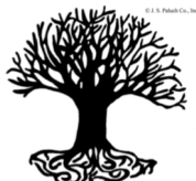
God is God of the living

That within parishes, priests and lay people may collaborate in service to the community without giving in to the temptation of discouragement.