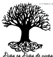
Dios es Dios de vivos

Por la Evangelización Colaboración entre sacerdotes y laicos. Para que en las Parroquias, sacerdotes y laicos, colaboren juntos en el servicio a la comunidad sin caeren la tentación del desaliento.